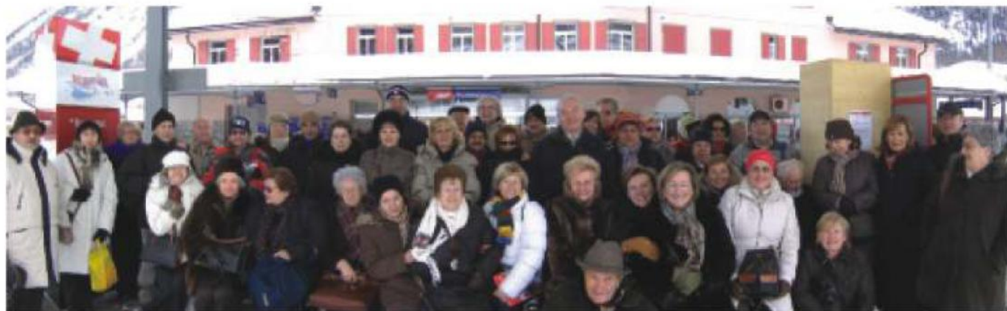
Il numeroso gruppo di Malnatesi che lo scorso gennaio è andato in gita tra le nevi del Bernina.