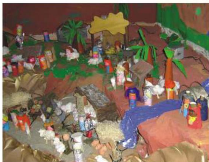
Sopra, il coloratissimo presepe che quest'anno ha fatto bella mostra di sé nell'atrio della scuola elementare di Malnate.

Ogni particolare è stato realizzato dai bambini: complimenti per la fantasia e l'originalità con cui hanno saputo trasformare materiali semplici e altrimenti destinati a diventare rifiuti in un vero capolavoro!